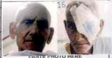
PASTE PHOTO HERE Preop Postop